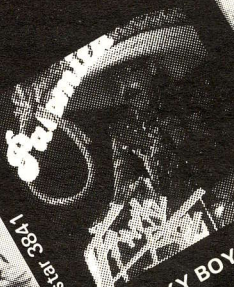
FRANKY BOY Palomita