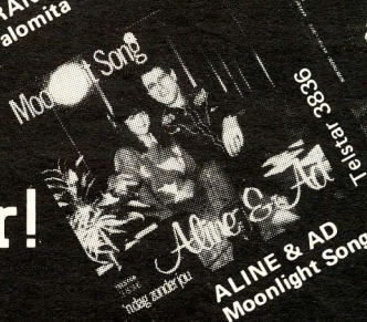
ALINE & AD Moonlight Song