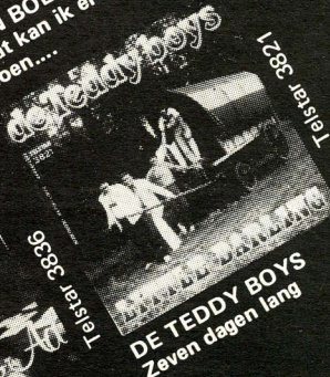
DE TEDDY BOYS Zeven dagen lang